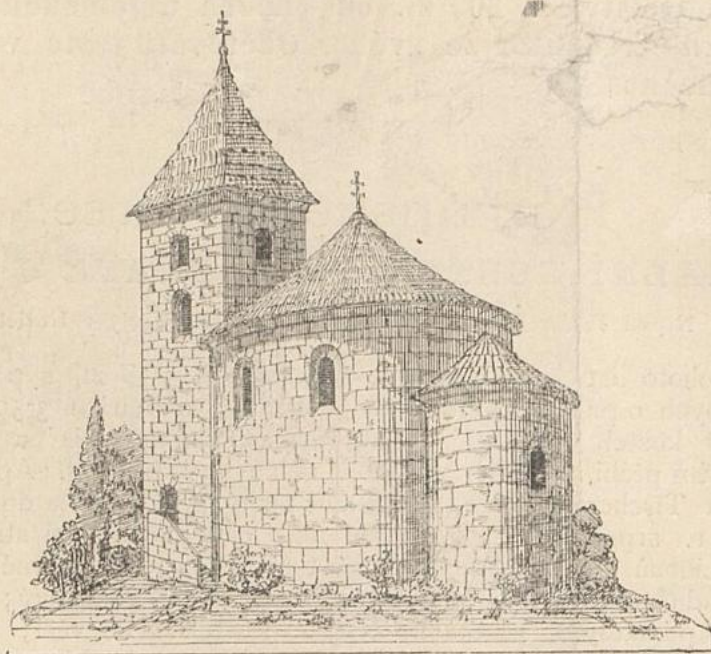
Nakreslil ředitel V. Dokoupil.