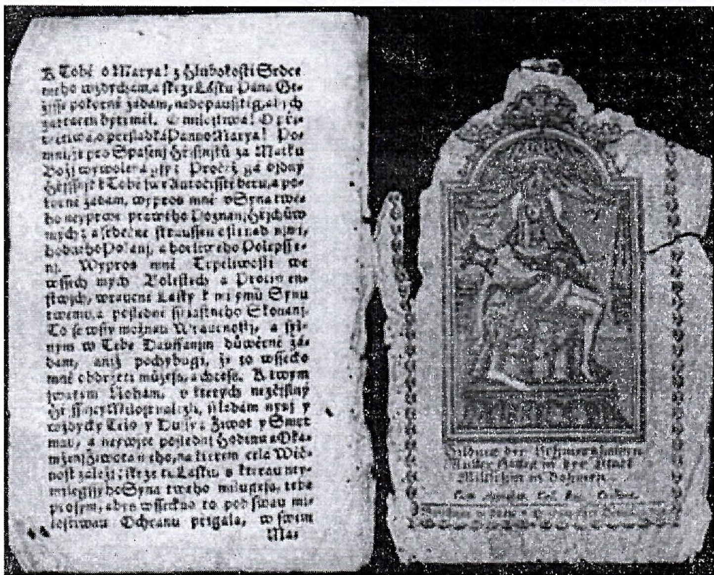
Varianta Piety Miličinské z roku 1794, kde je na titulní straně německý text. Na dalších stranách jsou modlitby a litanie psány v češtině. Muzeum Podblanicka Vlašim

Nový pohled na námi sledovanou problematiku v Miličině vneslo až zpřesněné hodnocení „miličinského“ konvolutu. 8) Jedná se o českou variantu tisku z roku 1794 – Obraz Rodičky Boží Bolestné w Miestie Miličine . Téměř vše podstatné o rytině je patrné z barevné přílohy. Tisk se skládá z více jak deseti modliteb, litanie, biblických citátů a dalších textů. Závěrečnou je Píseň o sedmi Bolestech B. P. M. [Blažoslavené Panny Marie], která má patnáct slok, z nichž pouze předposlední se konkrétně váže k Miličinu.