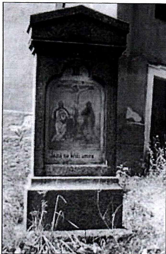
XII. zastavení žulové křížové cesty stoupající ke kapli Utrpení Páně, která stojí na vrchu Kalvárie nad Miličínem.