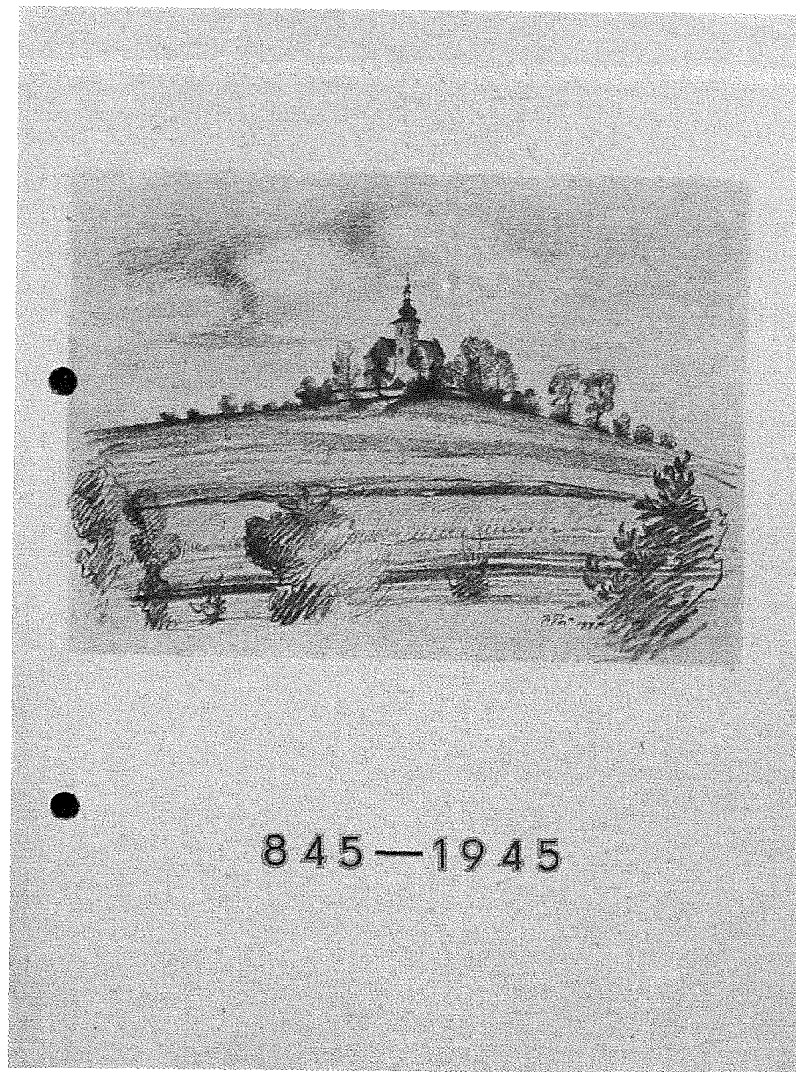
Obr. 1: Propagační tiskovina podporující sbírku na opravu kostela v Podolském Kostelci.